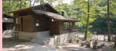
タイプにより料金が異なります(別紙料金表参照) (11:00~15:00)