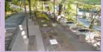
1人100円(相席となります)(10:00~16:00)